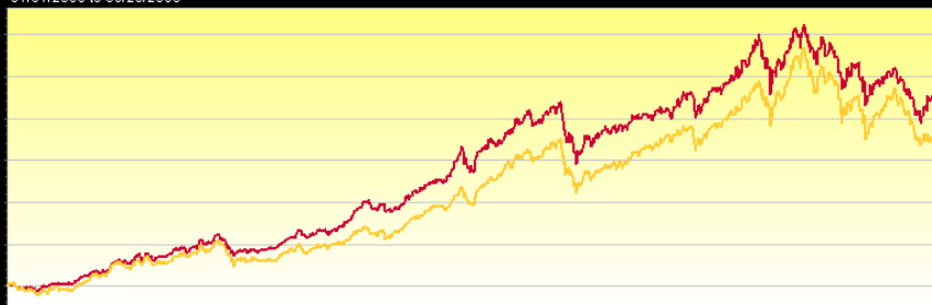
Cumulative Return Chart 01/01/2003 to 08/29/2008

— LK-Schwellenlaender R-Class Unterfonds — MSCI EMF (Emerging Markets) - Gross Return